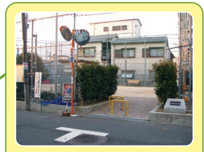
はらっぱ公園第1号の下新庄南公園