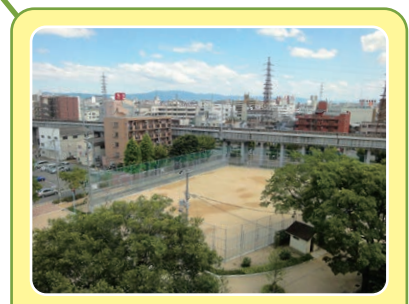
瑞光寺公園屋外プール跡地の瑞光寺公園