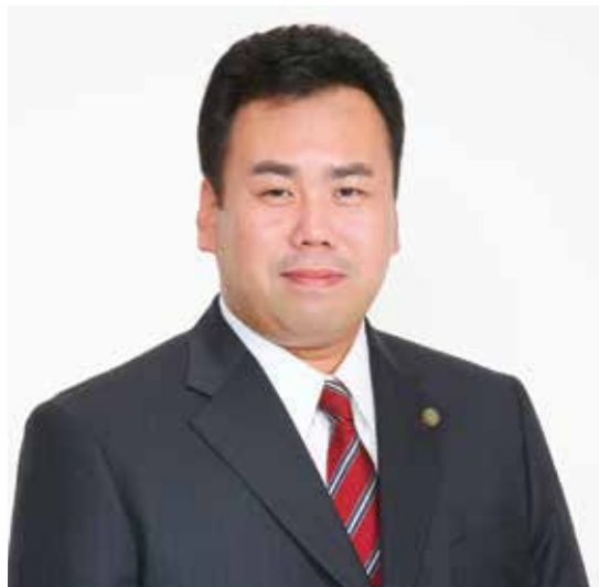
大阪市議員 床田正勝