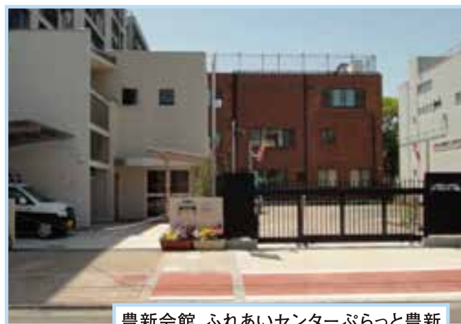
豊新会館 ふれあいセンターぷらっと豊新

そのような中、長期間の交渉の結果、平成22年9月に当民間会社により購入された豊新2丁目7番の土地（ふれあいセンターぷらっと豊新隣）は社会福祉法人へ売却、さらに、当計画を中止する旨の「事業計画書の取り下げ申請」が提出され、平成24年4月19日に大阪市に受理されました。