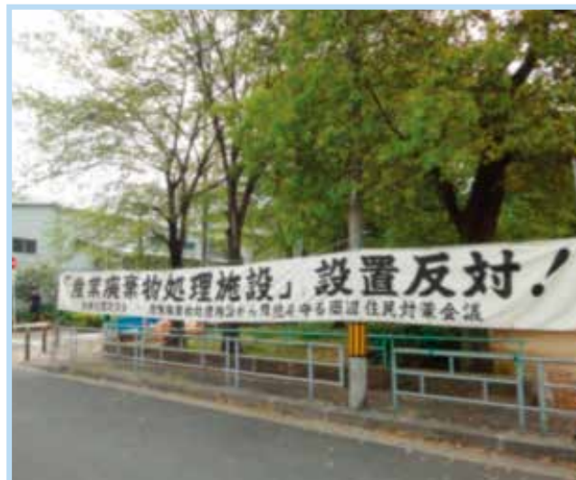
建設予定地前の多幸公園に反対の横断幕

そこで、豊新の皆様の声を大阪市に届けるために、大阪市と豊新の話し合いの場が必要と考え、平成21年11月20日に、豊新社会福祉協議会から大阪市長への要望書「産業廃棄物中継処理（積替え保管）施設設置阻止について」を提出いただくため、大阪市副市長と環境局長（共に当時）に立ち会っていただく場を準備・同席をさせていただきました。そこで、要望書を提出していただくと共に地元の声を大阪市のしっかりと伝えることができました。