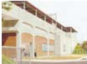
「(仮称)淡路駅計画図」