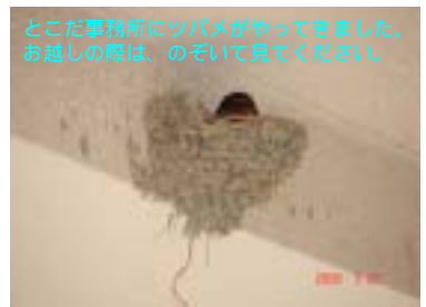
とこだ事務所にツバメがやってきました。 お越しの際は、のぞいてみてください。