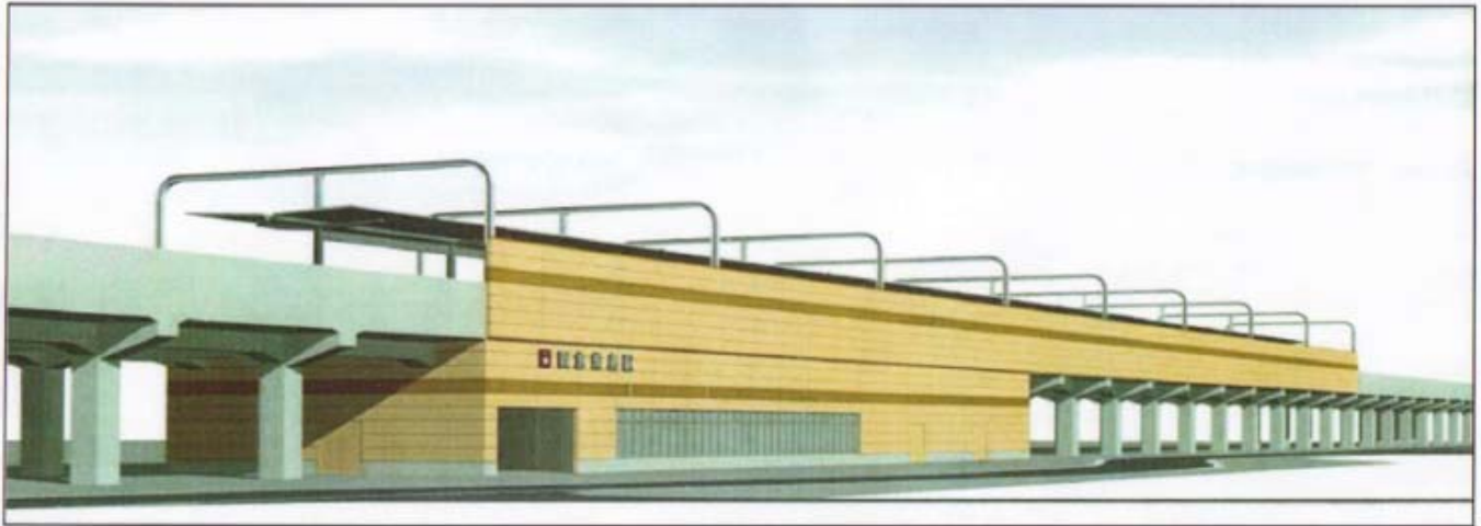
柴島駅完成イメージ図（案）