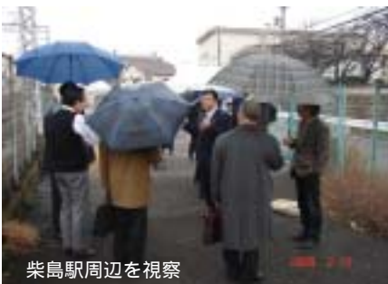
柴島駅周辺を視察

健康のため、駅まで徒歩で来ていただけるのが一番ですが、自転車をご利用の方は、是非 「駅前無料仮設駐輪場」をご利用ください!