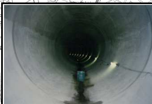
大隅 ~ 十八条下水道幹線 内径 4.5m (完成状況)

大隅 ~ 十八条下水道幹線整備事業 (延長約 3.1km、内径 5.25m) • H21 : 実施設計、ボーリング調査 • H22 : 鉄道影響解析 • H23 ~ H28 (予定) : 発進立坑築造、シールド工事