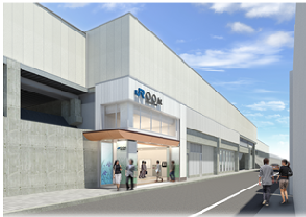
都島駅（仮称）イメージパース

新駅の位置する城北地域を含む旧淀川には多くの渡し場があり、水運とともに歩んできたことから、渡し舟が水面に浮いている様を表現しています。