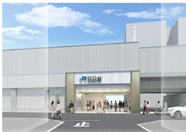
野江駅（仮称）イメージパース

鎌倉時代に能のルーツとなる榎並猿楽がこの地より発祥したことにちなみ、猿楽の衣装と能の舞台を引用し表現しています。