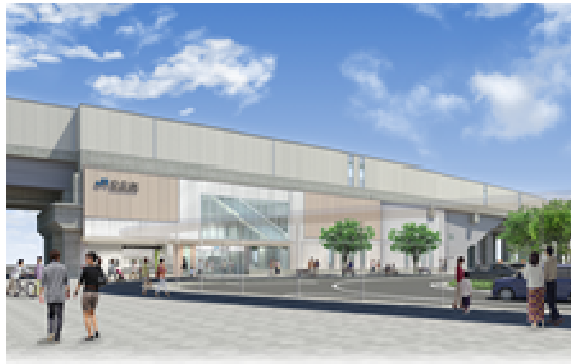
西吹田駅（仮称）イメージパース

新駅周辺は、神崎川の水資源を生かした水田、くわいの栽培地であった地域の歴史・風土のあるまちであることから、神崎川・水路の風景を表現しています。